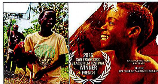
« Ti Coq » sera uniquement projeté en séance scolaire.

► 4 e Rencontres autour du festival européen du film d'éducation par les Ceméa - Gratuit - Contact : 0596.51.57.26.